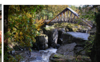
Cascade de Bracklinn