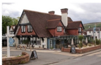
Tullie Inn - Balloch