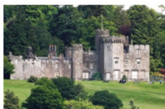
Château de Balloch

Nota : ⇒ Toute activité non prévue par le RCGD sera sous l'entière responsabilité de l'adhérent ⇒ Une bonne condition physique est requise (programme bien rempli + moyenne montagne)