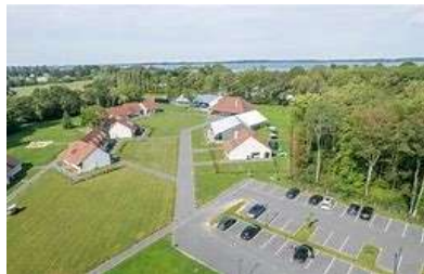
Hôtel du Lac D'Orient

Petit déjeuner Route vers Troyes Visite guidée du musée de l'outil MOPO Visite guidée de la ville de Troyes Déjeuner au restaurant boissons incluses Fin prestations