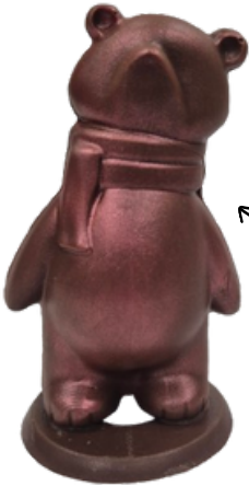
Ours écharpe 100g