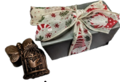
Mini ballotin 4 pces aléatoires