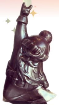
Père Noël Rock 100g