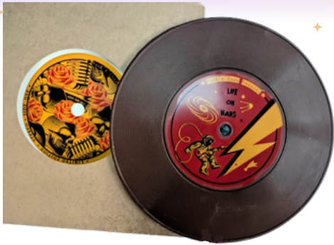
Vinyle (Stock limité)