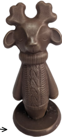
Lutin "Pointu" 160g