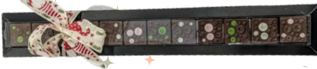
Réglette douceur nougat, marron, caramel