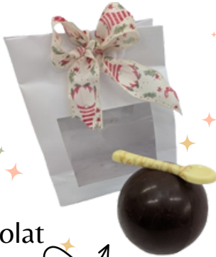
Kit chocolat chaud