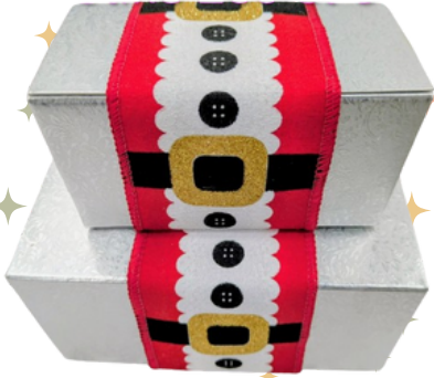
Ballotin 250 g